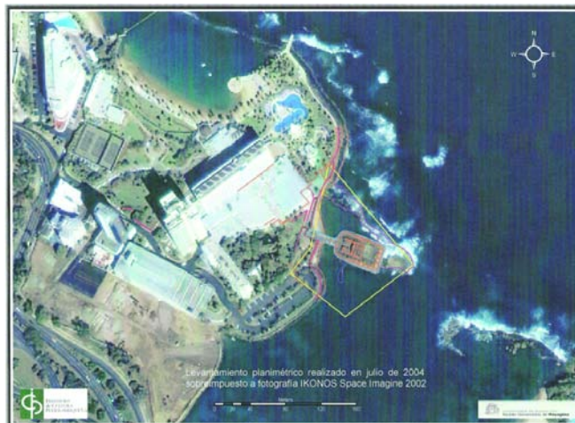
Levantamiento planimétrico de la zona, sobreimpuesto sobre fotografía IKONOS Space Imagine 2002.

Actualmente este caso se halla siendo estudiado por los Tribunales de Justicia de Puerto Rico. Las implicaciones legales, económicas y políticas de este asunto no permiten extendernos en los detalles técnicos (planos y registros) del estudio realizado por