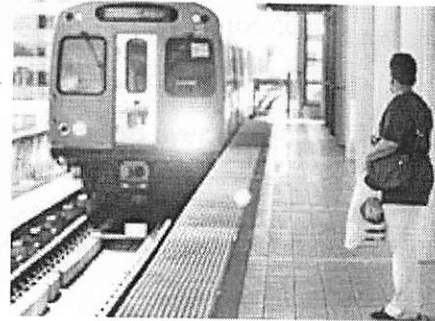
El DTOP y la Policía favorecieron el "Código de Orden y Conducta para los Usuarios del Sistema del Tren Urbano".